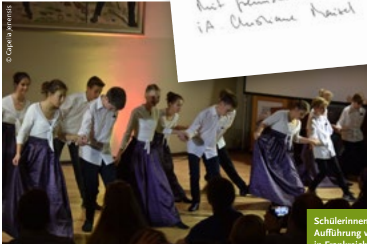
Schülerinnen und Schüler bei der Aufführung von „Tänzen wie Gott in Frankreich“ mit der Capella Jenensis. Das Projekt wurde von der DO-S unterstützt