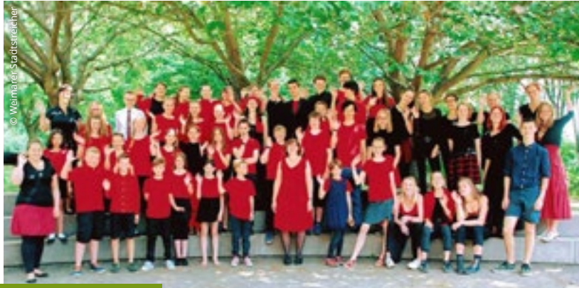
Zum 15-jährigen Bestehen hat das Weimarer Kinder- und Jugendstreicherorchester die von uns finanzierten Notenständer eingeweiht. Dieser Brief erreichte die DO-S anschließend – vielen Dank!