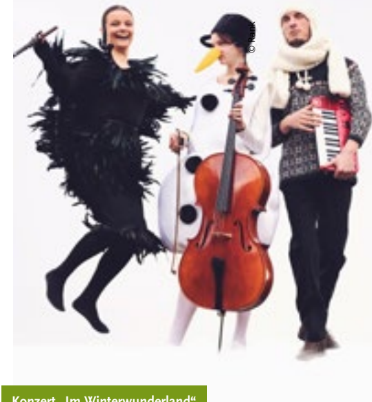
Konzert „Im Winterwunderland“