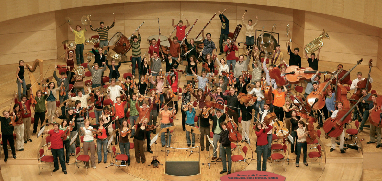
Das Bundesjugendorchester in der Philharmonie Essen

www.dov.org (Deutsche Orchestervereinigung e.V.) www.philharmonie-essen.de www.bundesjugendorchester.de www.orchesterstiftung.de www.listen-to-our-future.de www.dasorchester.de